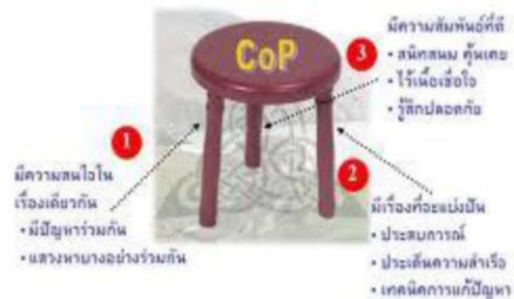
เมื่อคนทำงานแลกเปลี่ยนเรียนรู้กันอยู่เสมอ ก็เกิดเป็นชุมชนหรือ CoPs (Community of Practices) ขึ้นมา CoPs จะเกิดได้ต้องอาศัย 3 องค์ประกอบหลัก