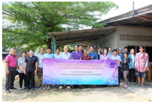
ภาพกิจกรรมลงพื้นที่กลุ่มฟักบ้านตาลเสี้ยน ตำบลรางสาลี อำเภอท่าวัง จังหวัดกาญจนบุรี