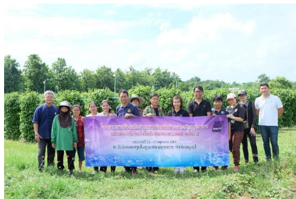
ภาพกิจกรรมลงพื้นที่กลุ่มเบญพาตร์รักษะเกษตรกร ตำบลพังตรุ อำเภอพนมทวน จังหวัดกาญจนบุรี