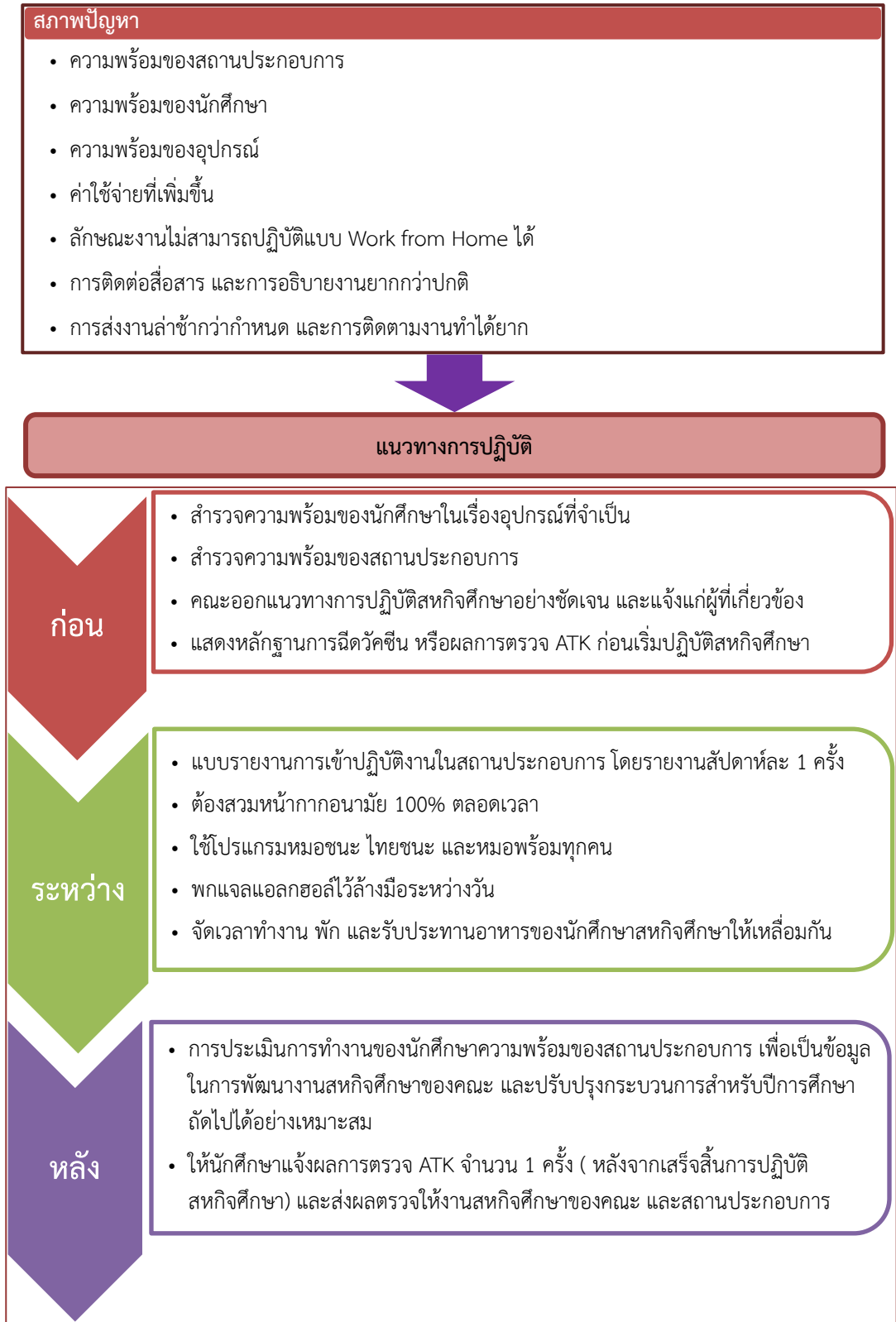
ภาพที่ 1 สภาพปัญหา และแนวทางการปฏิบัติสำหรับสหกิจศึกษาคุณวุฒิวชิวิตใหม่