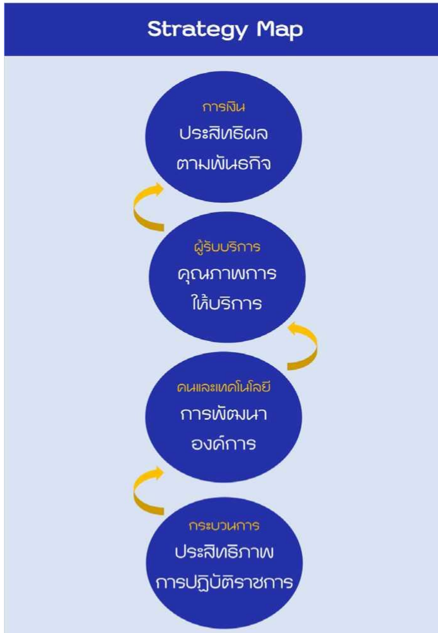
ภาพที่ 3.1 กรอบความคิดในการจัดทำแผนที่ยุทธศาสตร์การพัฒนามหาวิทยาลัยเทคโนโลยีราชมงคลพระนคร ฉบับที่ 13 (พ.ศ. 2566 - 2570)

แผนที่ยุทธศาสตร์ (Strategy Map) ของแผนพัฒนามหาวิทยาลัยเทคโนโลยีราชมงคลพระนคร ฉบับที่ 13 (พ.ศ. 2566 - 2570) ตามกรอบความคิด ดังนี้