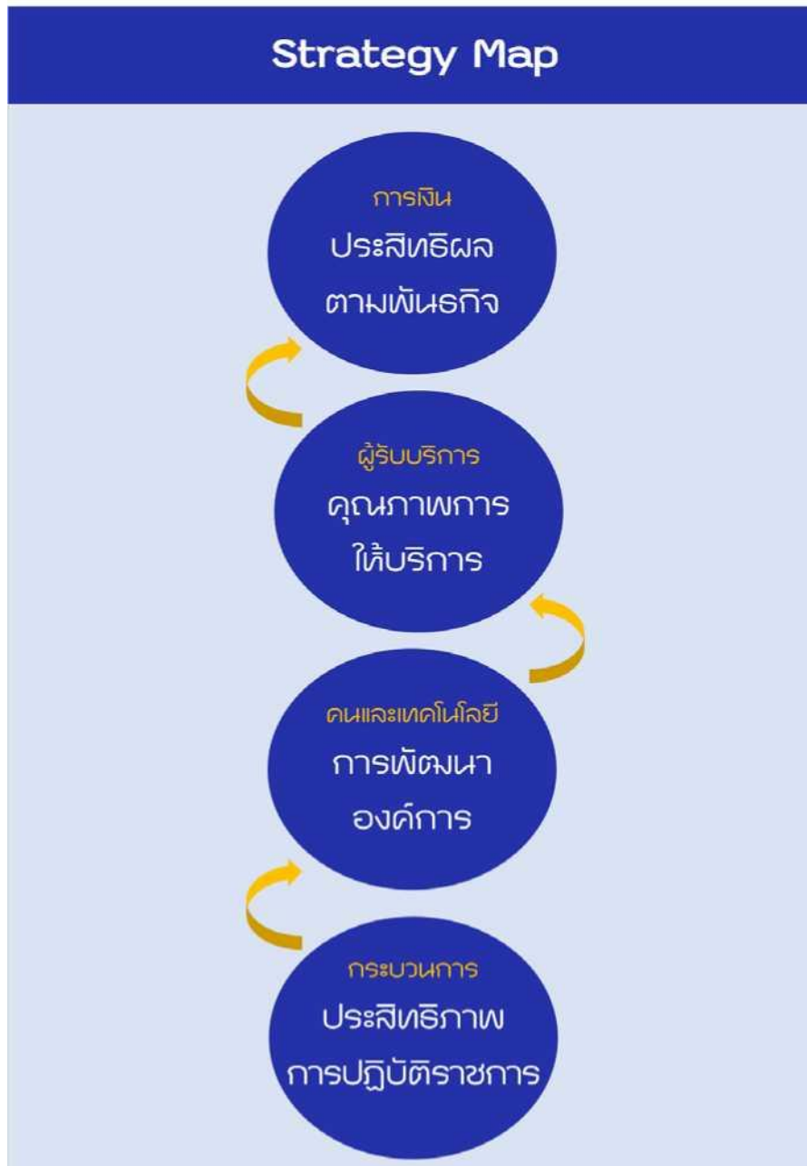
ภาพที่ 3.1 กรอบความคิดในการจัดทำแผนที่ยุทธศาสตร์การพัฒนามหาวิทยาลัยเทคโนโลยีราชมงคลพระนคร ฉบับที่ 13 (พ.ศ. 2566 - 2570)

แผนที่ยุทธศาสตร์ (Strategy Map) ของแผนพัฒนามหาวิทยาลัยเทคโนโลยีราชมงคลพระนคร ฉบับที่ 13 (พ.ศ. 2566 - 2570) ตามกรอบความคิด ดังนี้